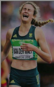
Trane van vreugde nêr 'n wêreldtitel.

rekord gebreek, so dis duidelik dat sy op die regte pad is." Daardie pad het egter in die maande voor die Finland-byeenkoms nie net atletiekhekkies gehad nie, Zeney moes heers wat balie in die lug hou. Die Affie is 'n besige meisie: Primaria van haar koshuis, 'n matrikulant wat droom van verdere studies en bowenal iemand wat die hoogste sport in atletiek wil bereik.